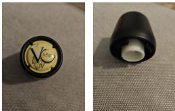
Bouchon hermétique pétillant