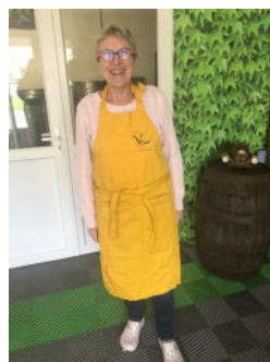
Tablier, merci à notre mannequin