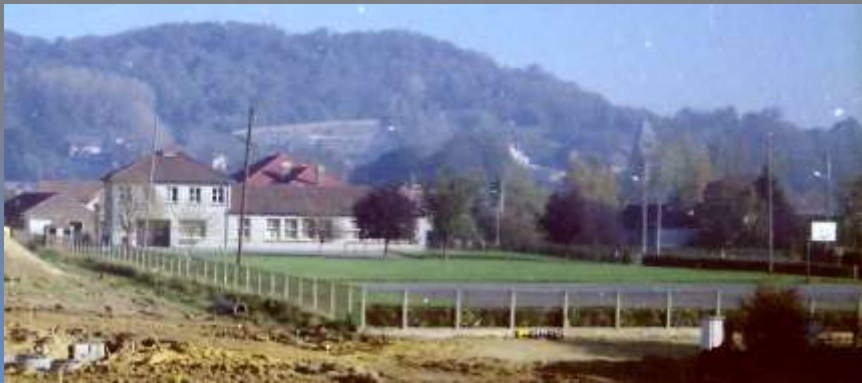
Une vue des années 1980...