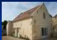
Le comité de Jumelage Clairoux - Dormitz