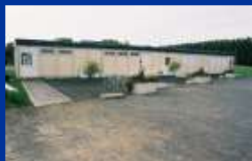
Le Club-House du Bicross de Compiègne-Clairoix