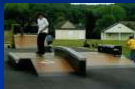
Le Roller-Skate Parc