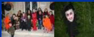
Les Soirées Halloween