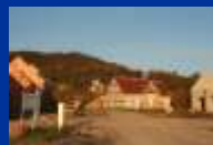
Impasse René DRUJON