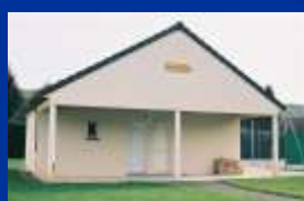
Le Club-House du Tennis