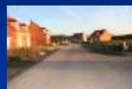
Impasse Louis BAYART