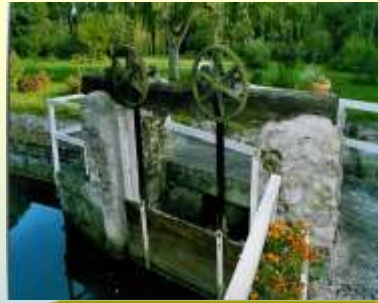
Le moulin des Avenelles