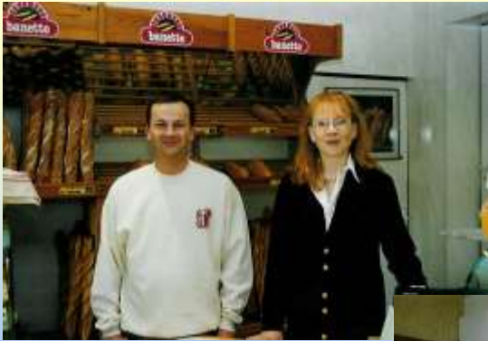
Boulangerie Pâtisserie F.Papin