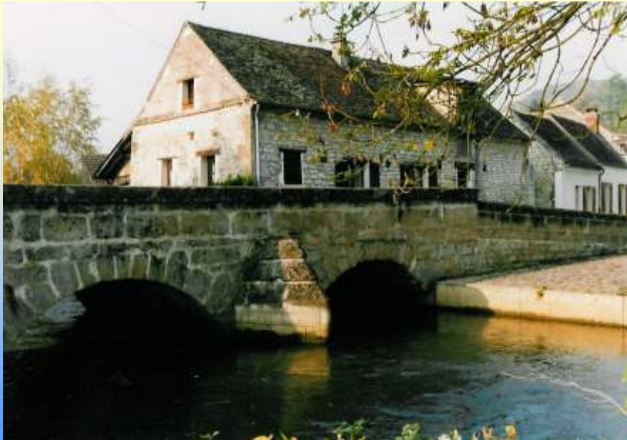
Le pont de pierres