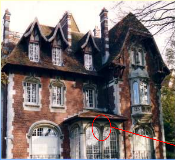
La Maison Sibien