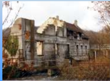
Le moulin à tan