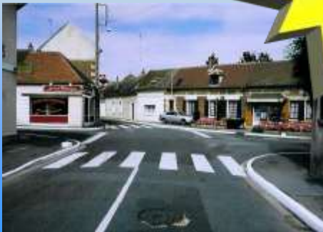
du centre bourg