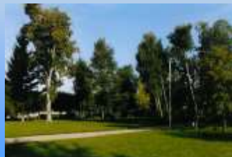
Le Parc du clos de l'Aronde