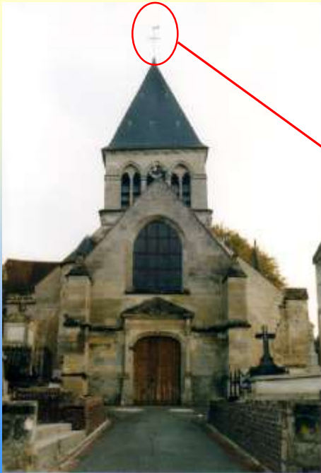
L'église Saint Etienne