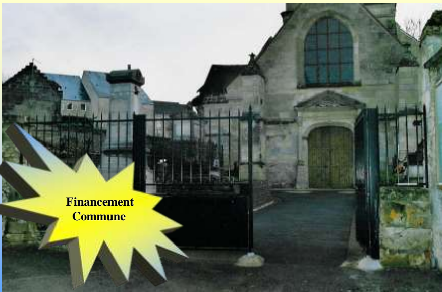
Le portail de l'église Saint Etienne