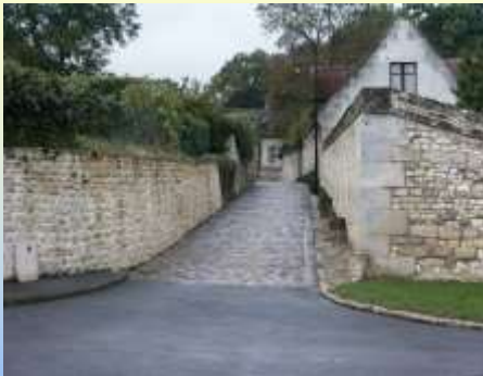
La rue du moulin Bacot