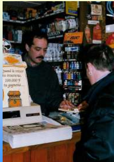
Café «Au bon coin»