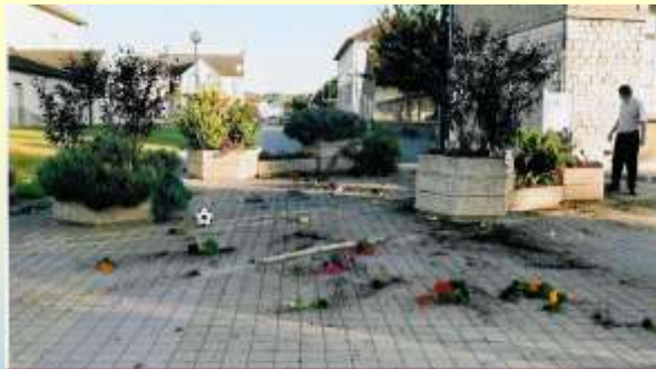
Le travail de tous anéanti ...