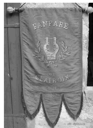
Bannière de 1867

Citons enfin « La Sauvegarde de Clairoix », fondée en 1978 pour préserver le cadre de vie clairoisien, menacé notamment par la « rocade » (qui devait, selon son projet initial, franchir « à niveau » la Planchette - rue de la Poste - et ainsi couper la commune en deux) ou certains projets immobiliers (qui n'ont pas vu le jour). Elle a compté jusqu'à 200 adhérents. C'est l'association « Art, Histoire et Patrimoine de Clairoix » qui a pris la suite, en 1993, de cette association qui était devenue « en sommeil ».