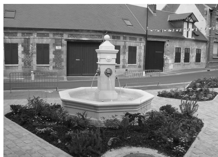
La fontaine inaugurée en 2003

Les actions actuelles comprennent des échanges scolaires, ainsi que des cours d'allemand et de français au profit des deux communautés, tous âges confondus.