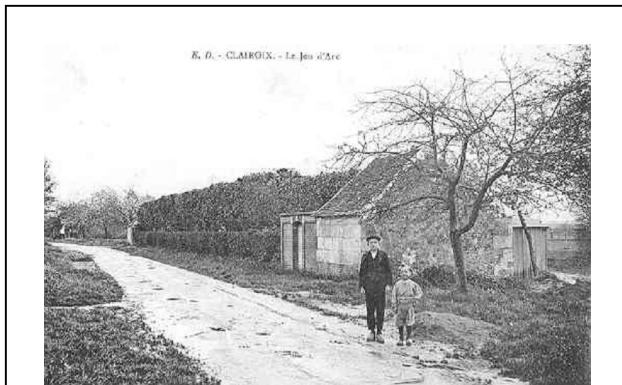
L'ancien jeu d'arc, dans les années 1910

Très probablement la plus ancienne du village, cette association a plus de 227 ans ! (La compagnie possède un livre de comptes rendus d'activités depuis 1776). Sa santé a certes eu des hauts et des bas, mais elle poursuit encore actuellement, avec une vingtaine de membres, ses