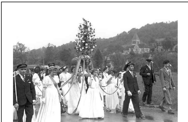
Le 11 mai 1947, lors du Bouquet

Depuis des siècles, regroupées au sein de « familles » et de « rondes » (unions régionales), les diverses compagnies d'arc organisent à tour de rôle, chaque printemps, une manifestation sportive et festive appelée « Bouquet provincial ».