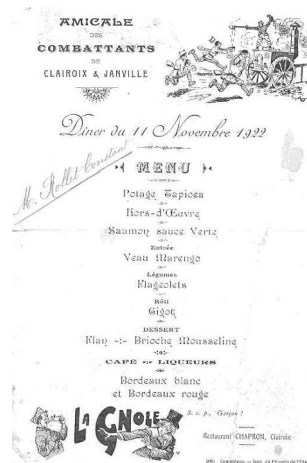
Amicale des combattants : menu du dîner du 11 novembre 1922