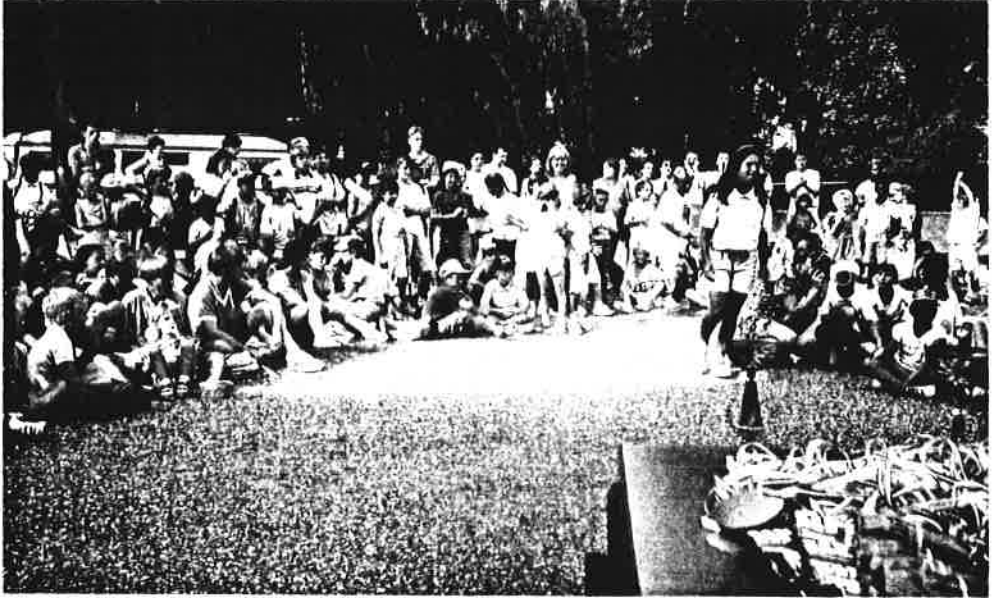
▲ "Les Jeux Olympiques"

Pour clôturer le centre, les enfants de Clairoux ont eu la joie d'inviter leurs camarades de Coudun, Longueil-Annel et Margny-lès-Compiègne aux premiers Jeux olympiques de Clairoux. Cette journée très réussie grâce au temps et à l'excellent encadrement, a réuni plus de 300 enfants.