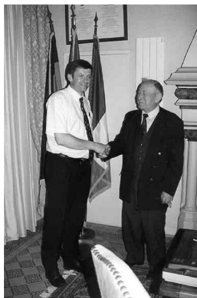
Les deux derniers maires de Clairoix, lors de la passation de pouvoir, en 2000