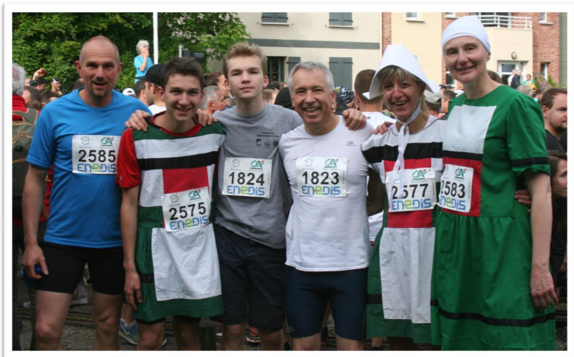
Une partie de la dream team