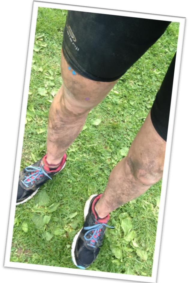
No comment !