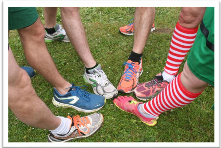
Dernières images des baskets propres