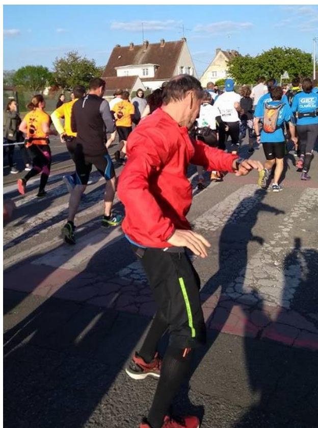
C'est parti !