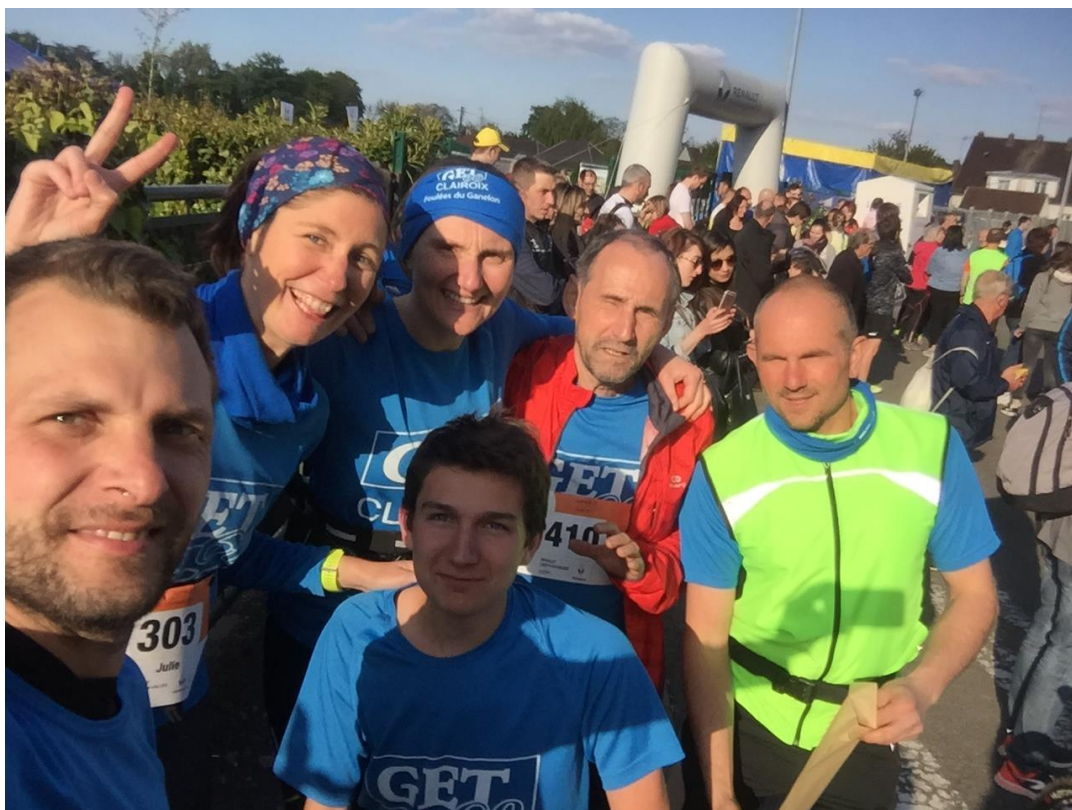
Avant le départ