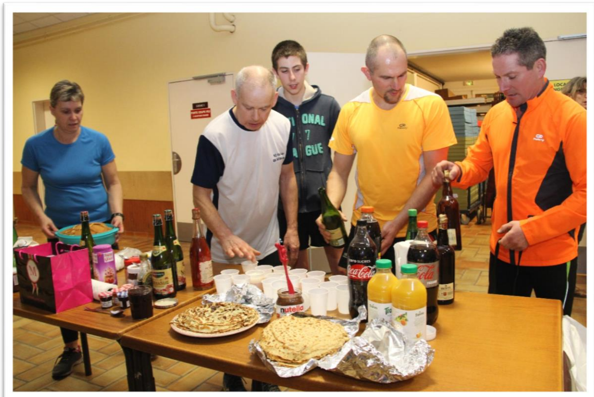
Un petit encas après la PPG !